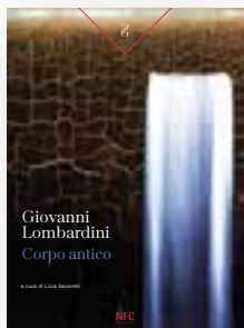
GIOVANNI LOMBARDINI CORPO ANTICO a cura di Livia Savorelli