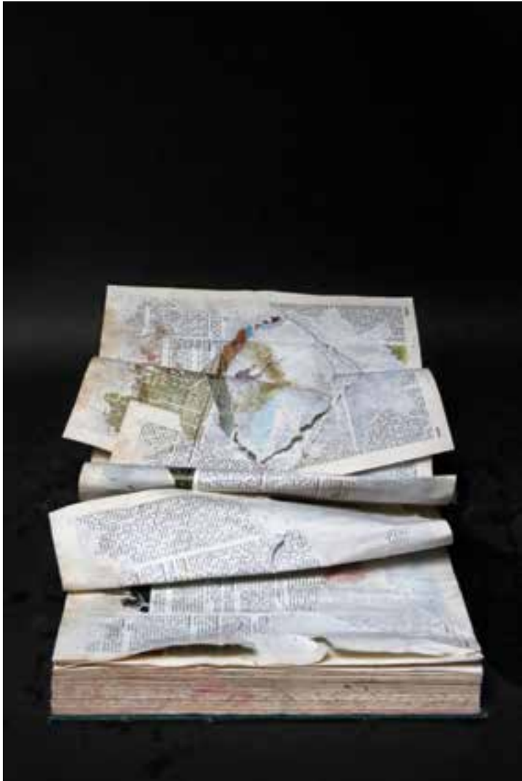
Acqua Alta #26, 2019