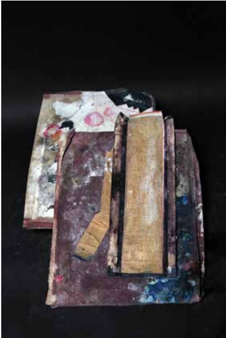
Acqua Alta #28, 2019