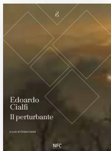
EDOARDO CIALFI IL PERTURBANTE a cura di Chiara Canali