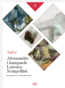
TALÉE ALESSANDRO GIAMPAOLI LORENZO SCARPELLINI a cura di Ilaria Bignotti e Camilla Remondina